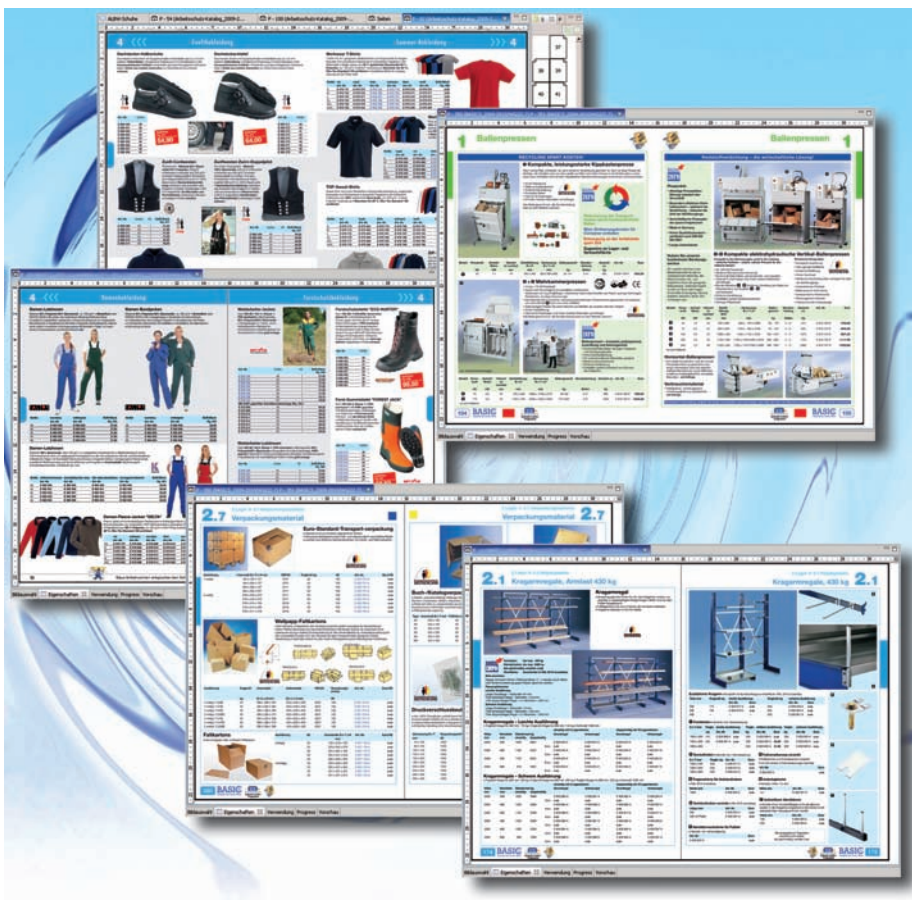
Screenshots aus dem CX30-System der E.I.S.

Neben den frei gestalteten Katalogen sollte ein neues System auch bei der Bearbeitung und der Erzeugung von stark strukturierten Katalogen